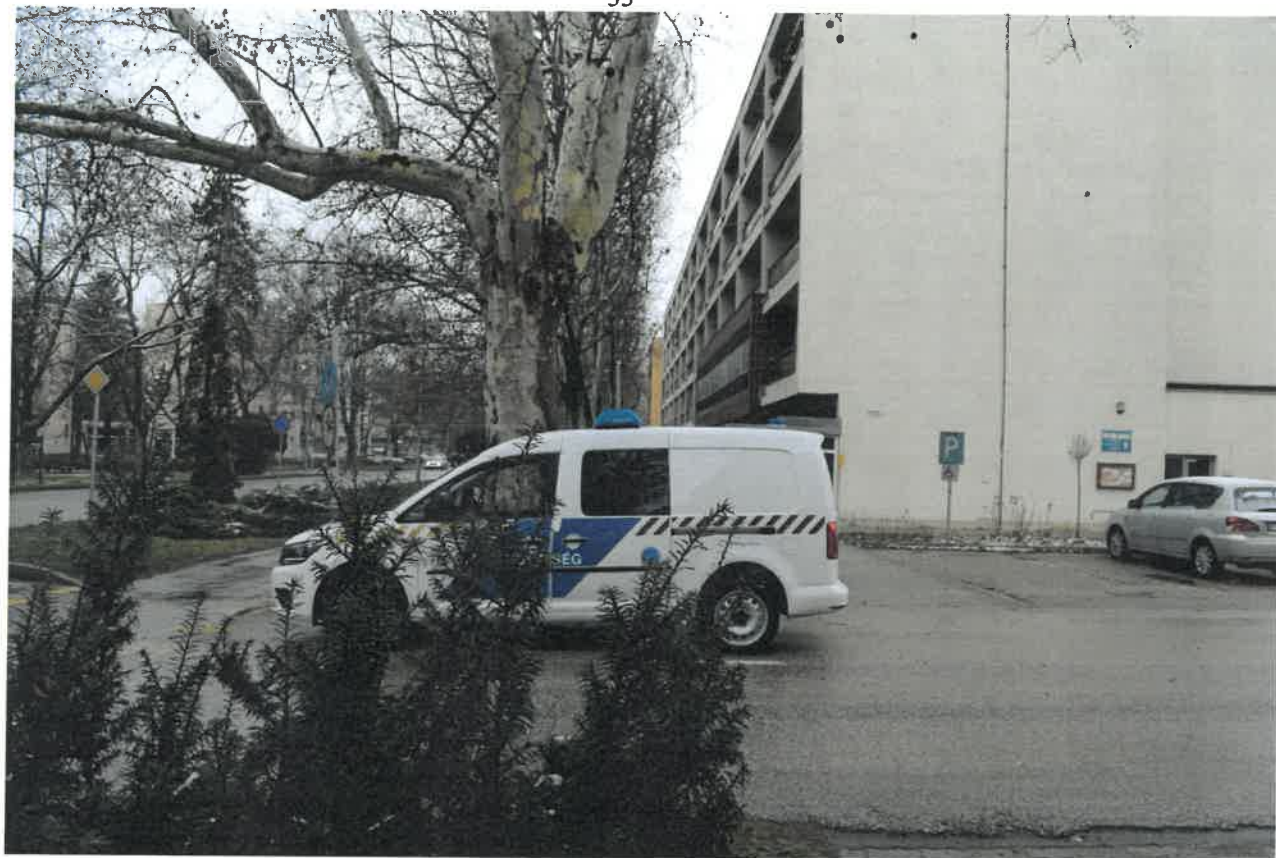
A Jókai utcai kereszteződésnél a baloldaltól érkezők észlelhetőségét a zöld bokor korlátozza. Nyári időszakban teljes a kitakarás a növényzet mérete miatt. Célszerű a kivágása.