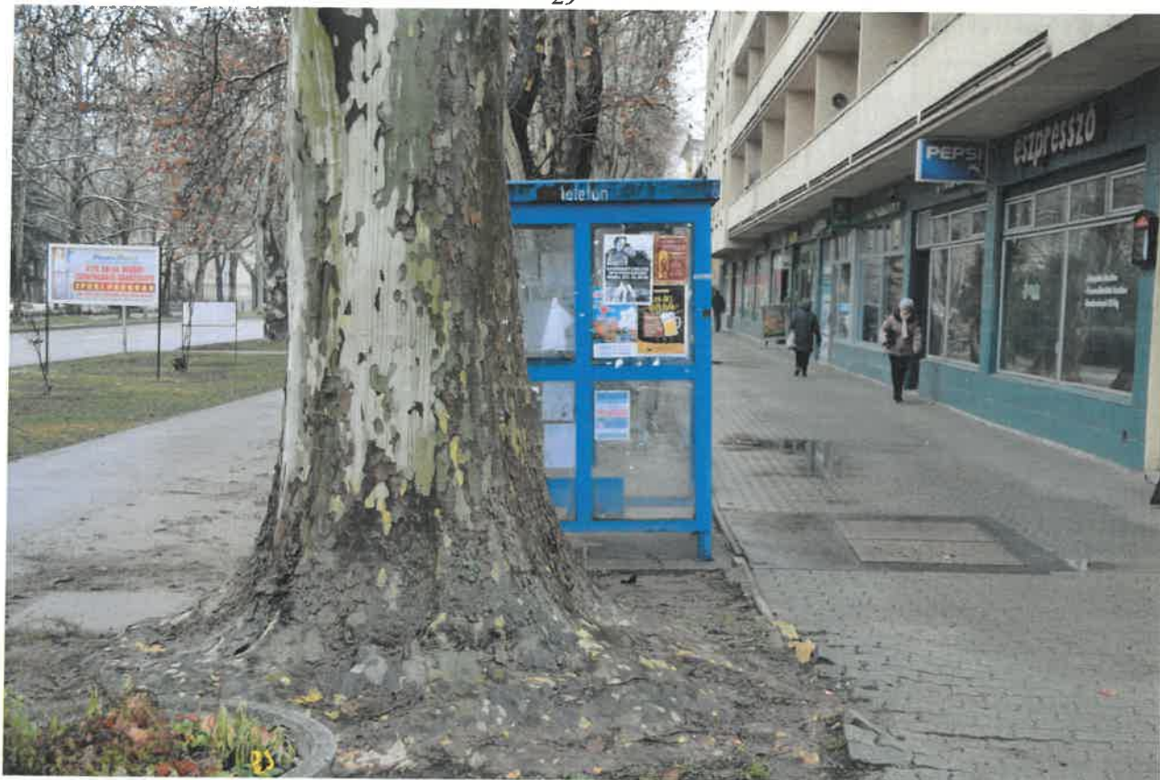
Fő utca Jókai Mór utca kereszteződése 30-as kép.