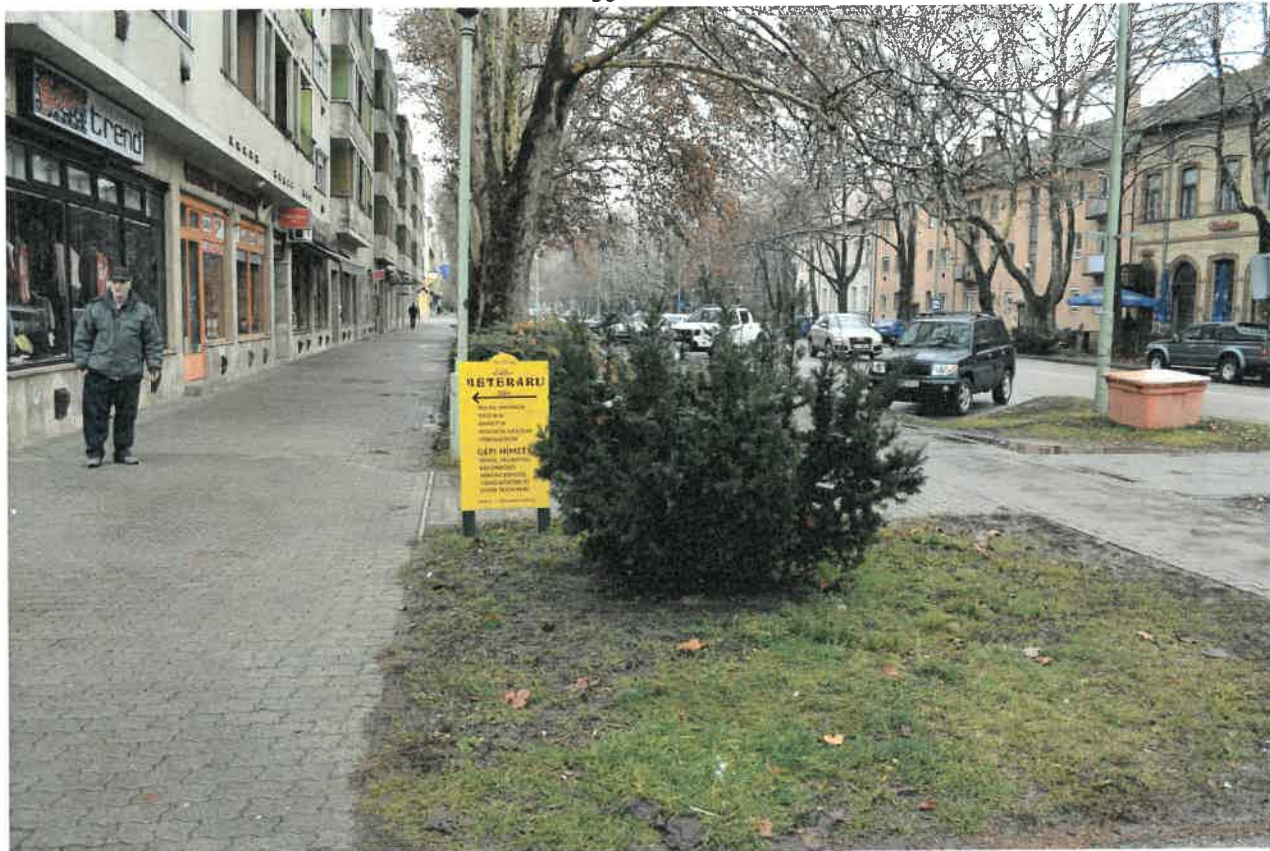
Fő utca Fővenyi utca kereszteződése. 36-os kép