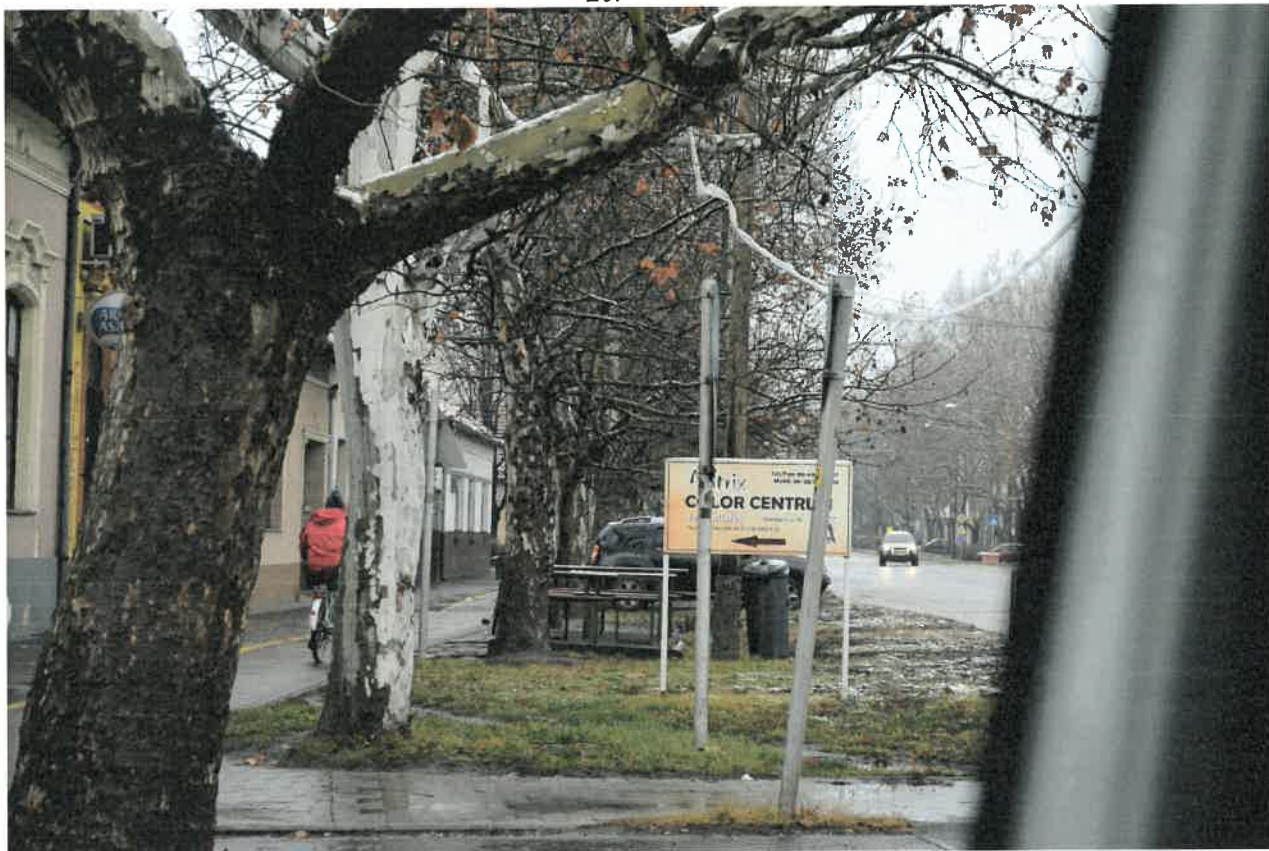
Az Új utca Lidl felé vezető szakaszán a kerékpáros forgalmat meg kell szüntetni. Táblával és felfestés felmarásával (21-es kép).