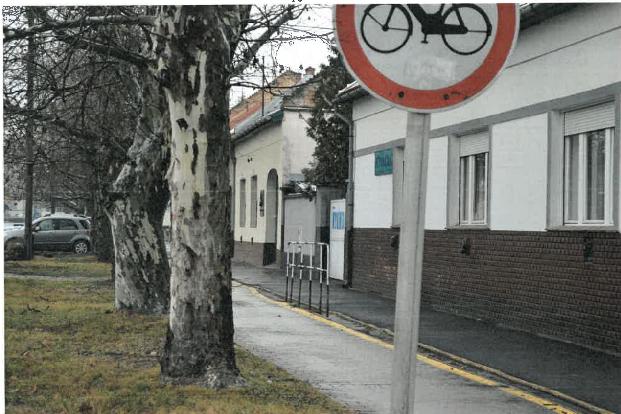
A Fő utca Új utca kereszteződése 17-18-19-20. A 20-22-es képeken egy mozgásban lévő kerékpáros is van. Jól érzékelteti a fénykép, hogy mekkora a kitakarás, ami a fa kivágását indokolja.