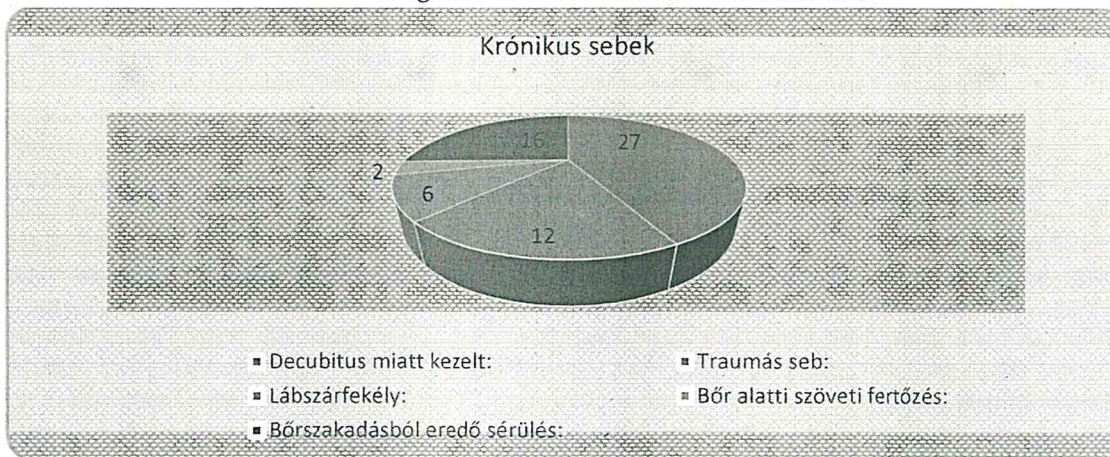
1. diagram Krónikus sebek eloszlása 2023.-ban

Nagy előnyt jelent az intézmény életében, hogy az egészségügyi ellátás megszervezését az intézményen belül meg tudjuk oldani a velünk személyes közreműködői szerződésben álló orvosokkal.