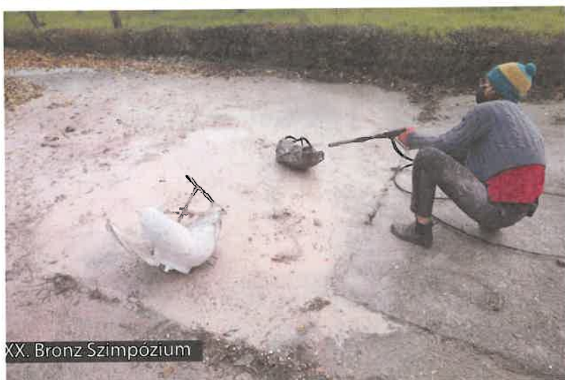
XX. Bronz Szimpózium