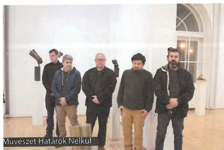
Művészet Határok Nélkül