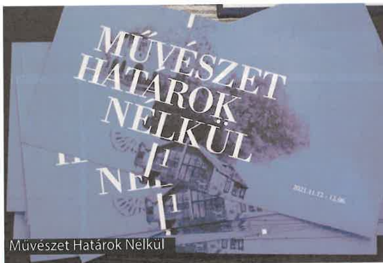
Művészet Határok Nélkül