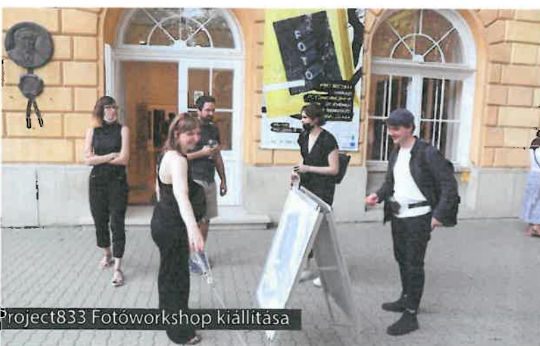
Project833 Fotóworkshop kiállítása