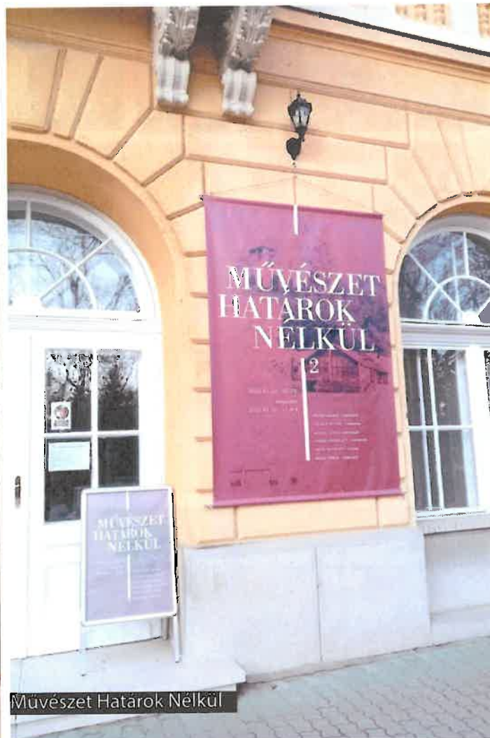
Művészet Határok Nélkül