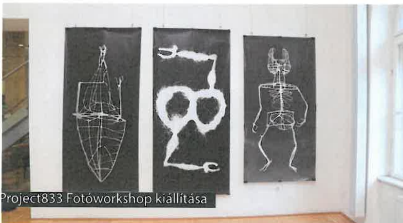
Project833 Fotóworkshop kiállítása