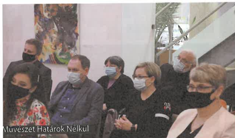
Művészet Határok Nélkül