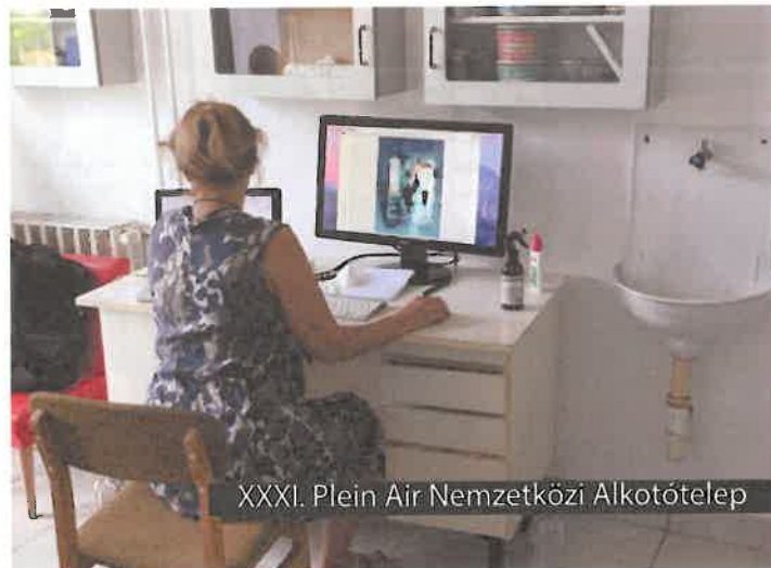
XXXI. Plein Air Nemzetközi Alkotótelep