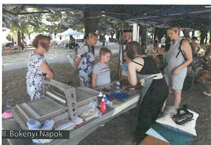
II. Bökényi Napok