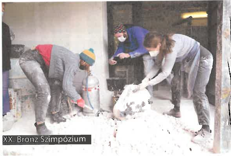
XX. Bronz Szimpózium