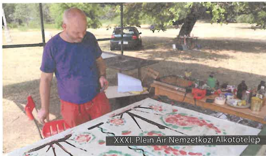
XXXI. Plein Air Nemzetközi Alkotótelep