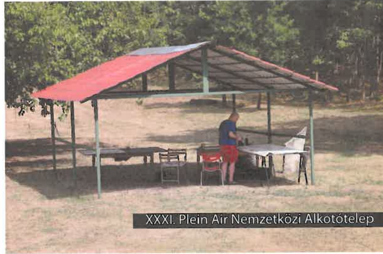
XXXI. Plein Air Nemzetközi Alkotótelep