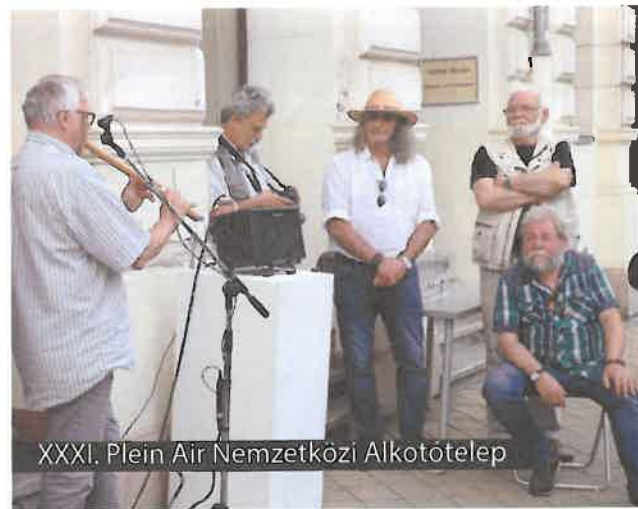
XXXI. Plein Air Nemzetközi Alkotótelep