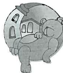
Kuckó - Mackó

2022. első félévében a Templom utcai „Mesevár” Bölcsőde és a Széchenyi úti „Kuckó-mackó” Bölcsőde szakdolgozói a kisgyermekellátását magas szintű gondozó-nevelő munka megvalósításával biztosították.